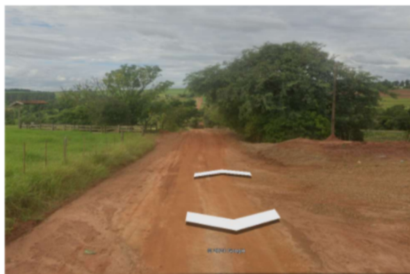
Trecho 01 (Estrada Farinheira) — (Início até 40 m)