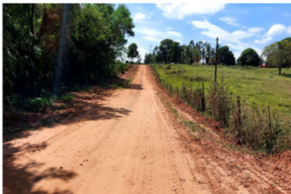
Trecho 04 (Estrada Farinheira) – (de 270 até 380)