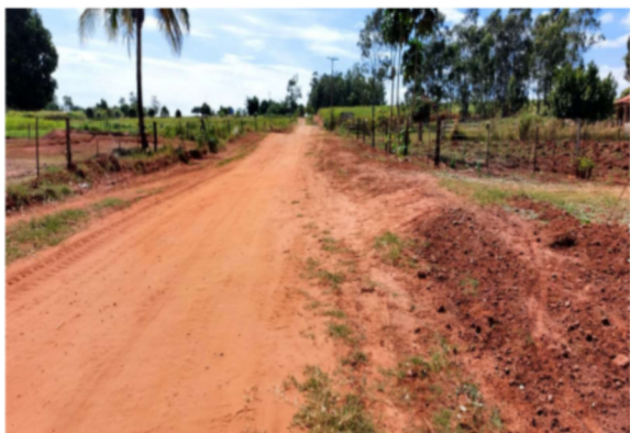
Trecho 05 (Estrada Farinheira) – (de 380 m até 560 m)