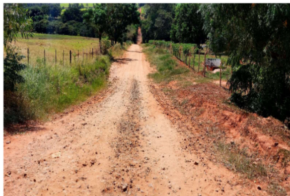
Trecho 02 (Estrada Farinheira) — (de 40 até 140 m)