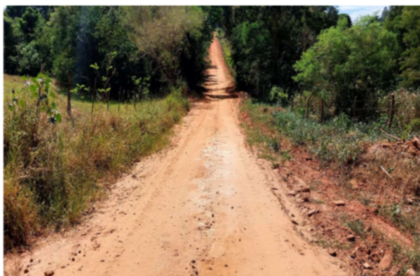
Trecho 03 (Estrada Farinheira) – (de 140 até 270 m)