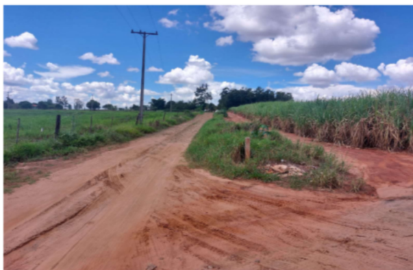
Trecho 06 (Estrada Farinheira) – (de 560 m até o Final)